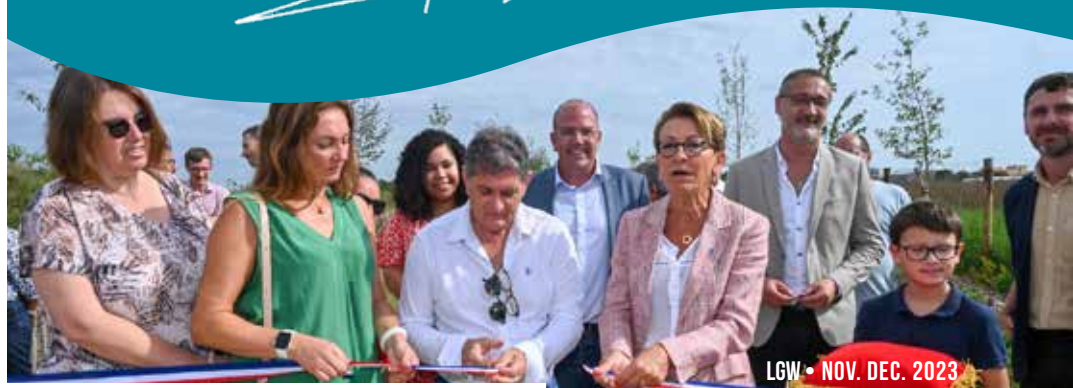
Inauguration de la boucle de promenades agricoles le 17 septembre