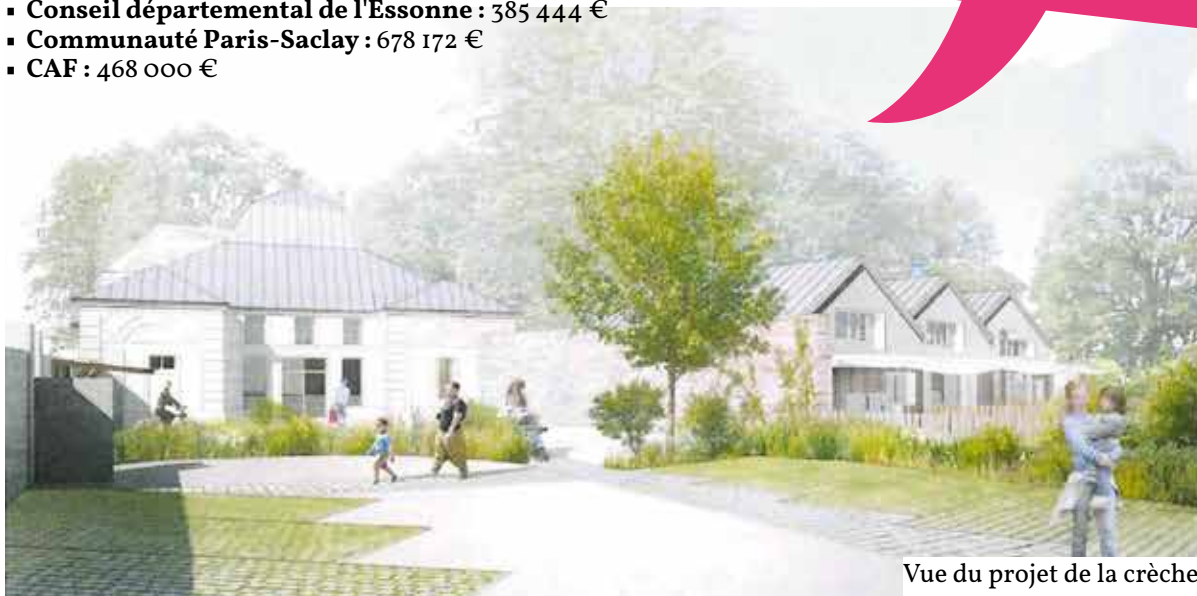
Vue du projet de la crèche.

Cette proximité permettra aux enfants de participer à des animations et des ateliers proposés par la bibliothèque.