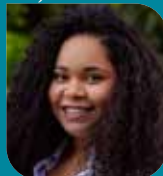
Léna Coco Urbanisme et commerce